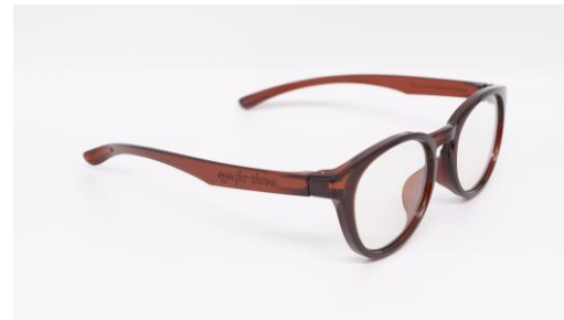
ブルーライトカット眼鏡